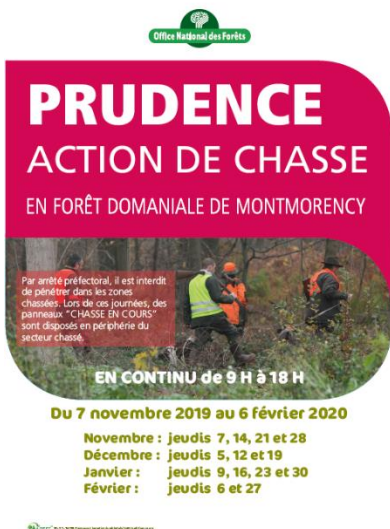
Le calendrier des jours chassés est positionné sur les panneaux en forêt. Exemple de Montmorency